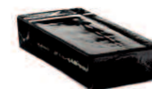
NORDICA VETROPIENO - RETTANGOLARE