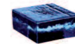
BLU VETROPIENO - QUADRATO