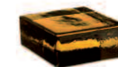
SIENA VETROPIENO - QUADRATO