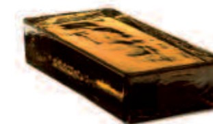
SIENA VETROPIENO - RETTANGOLARE