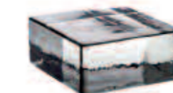
NEUTRO VETROPIENO - QUADRATO