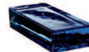
BLU VETROPIENO - RETTANGOLARE