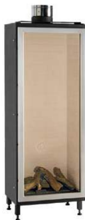
Mod. IG 50