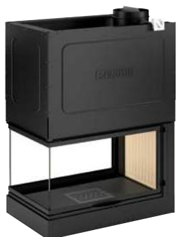
Mod. MA 272 SL