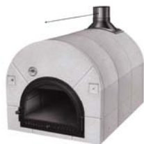
Mod. CHEF 102

Forno a legna a fuoco diretto. Realizzato in refrattario a doppia intercapedine superiore per un maggior recupero del calore, ha un ampio sportello con vetro ceramico e indicatore della temperatura interna. È dotato di registro fumi con regolazione manuale.