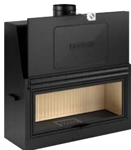
Mod. MA 264 SL

MONOBLOCCHI CON ANTA SALISCENDI FIREBOXES WITH RISE N'FALL DOOR