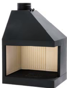
Mod. MA 282 D/S