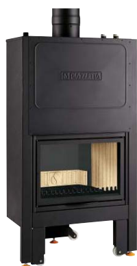
Mod. MT 600