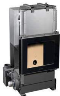
Mod. MP 973 TH

ACQUA CALDA E MASSIMO COMFORT Integrabile anche con l'impianto esistente.