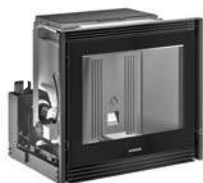
Mod. IP 78/68