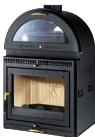
Mod. E 65/58MF

BRACIERE IN GHISA Praticità e alti rendimenti.