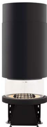
Mod. M360 T