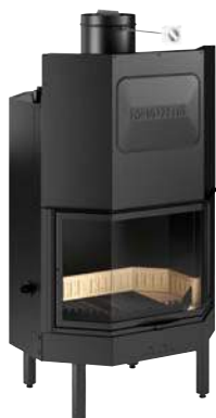
Mod. MT 370