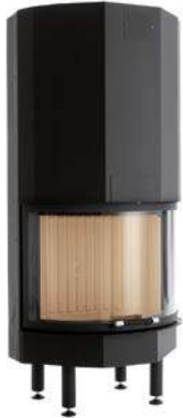
Mod. HT 760T