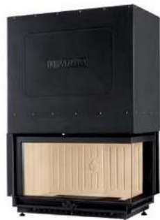
Mod. ME 90/44