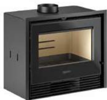
Mod. IL 65/56 V