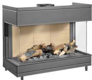
Mod. IG 85 3V