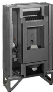
Mod. MP 938