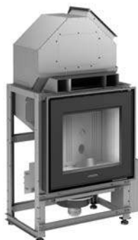
Mod. MP 973