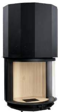
Mod. ME 84/70T