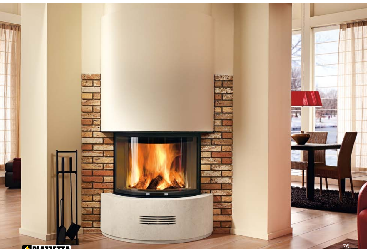
Photo showing wood firebox HT 600 - Dim. Surround LxWxH 129 x 86 x 114 cm. Compatibility table page 110

In foto focolare a legna HT 600 - Dim. Riv. LxPxH 129 x 86 x 114 cm. Tabella compatibilità pag. 110