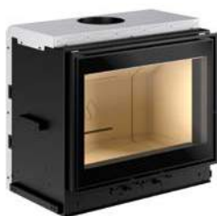
Mod. MC 70/51