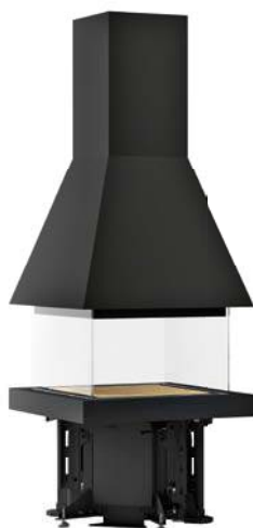
Mod. M360 Q