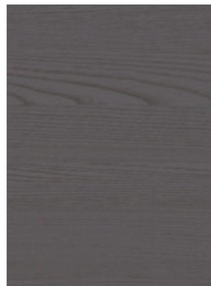
Antracite / Anthracite / Anthracite