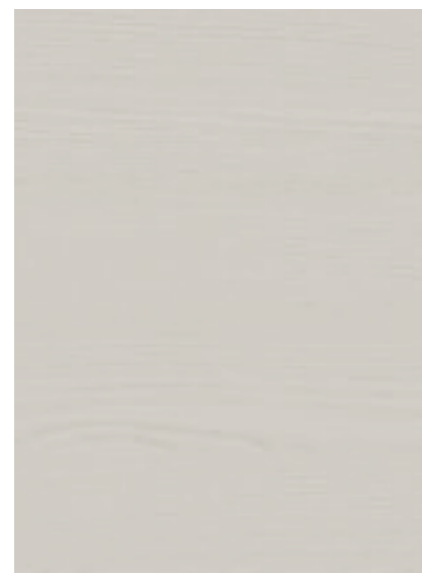
Sabbia / Sand / Sable