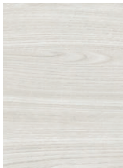
Ghiaccio / Ice / Glace