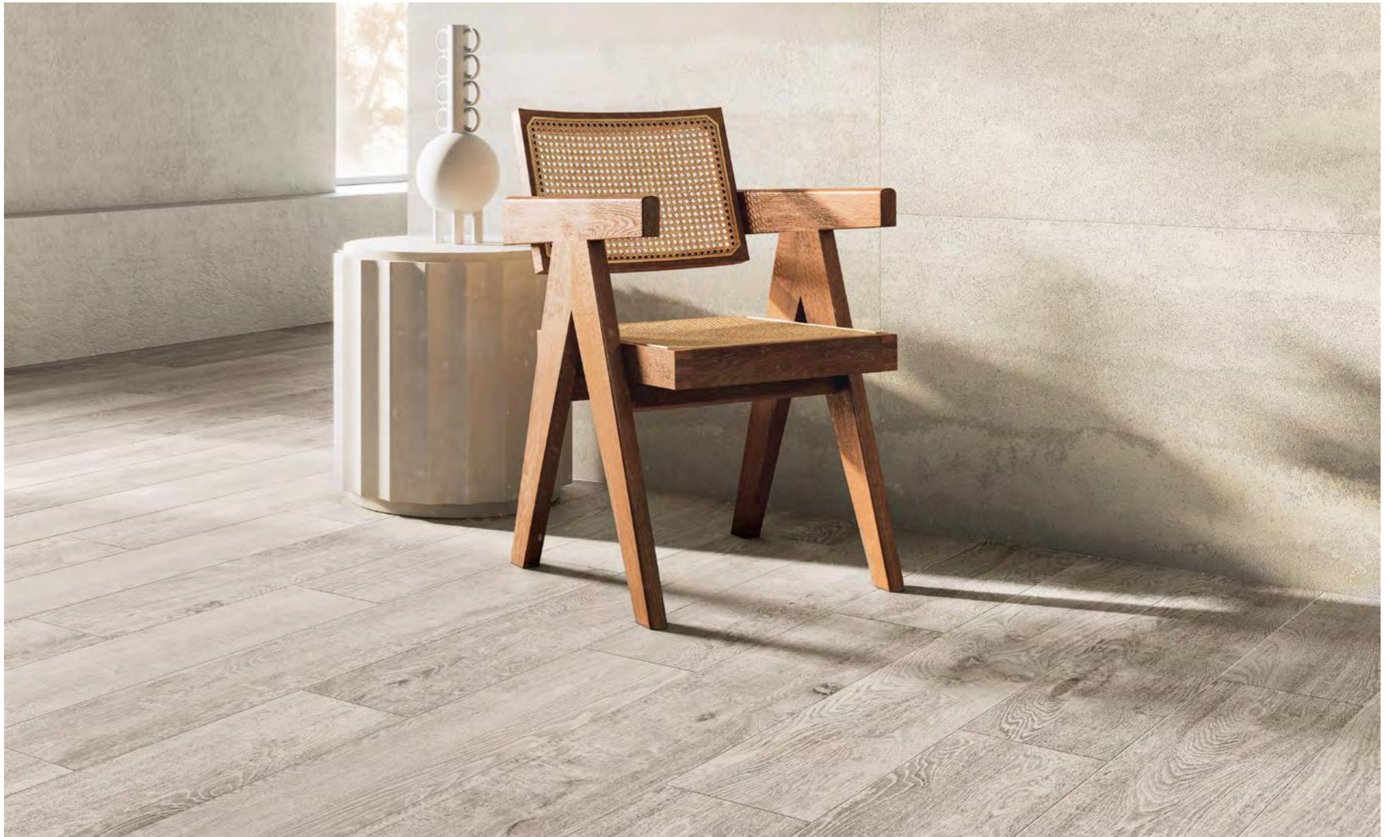
Luni Cenere Naturale 20x120 / 7,9"x47,2" - Terrae Decoro Giada Gesso Naturale 60x120 / 23,6"x47,2"