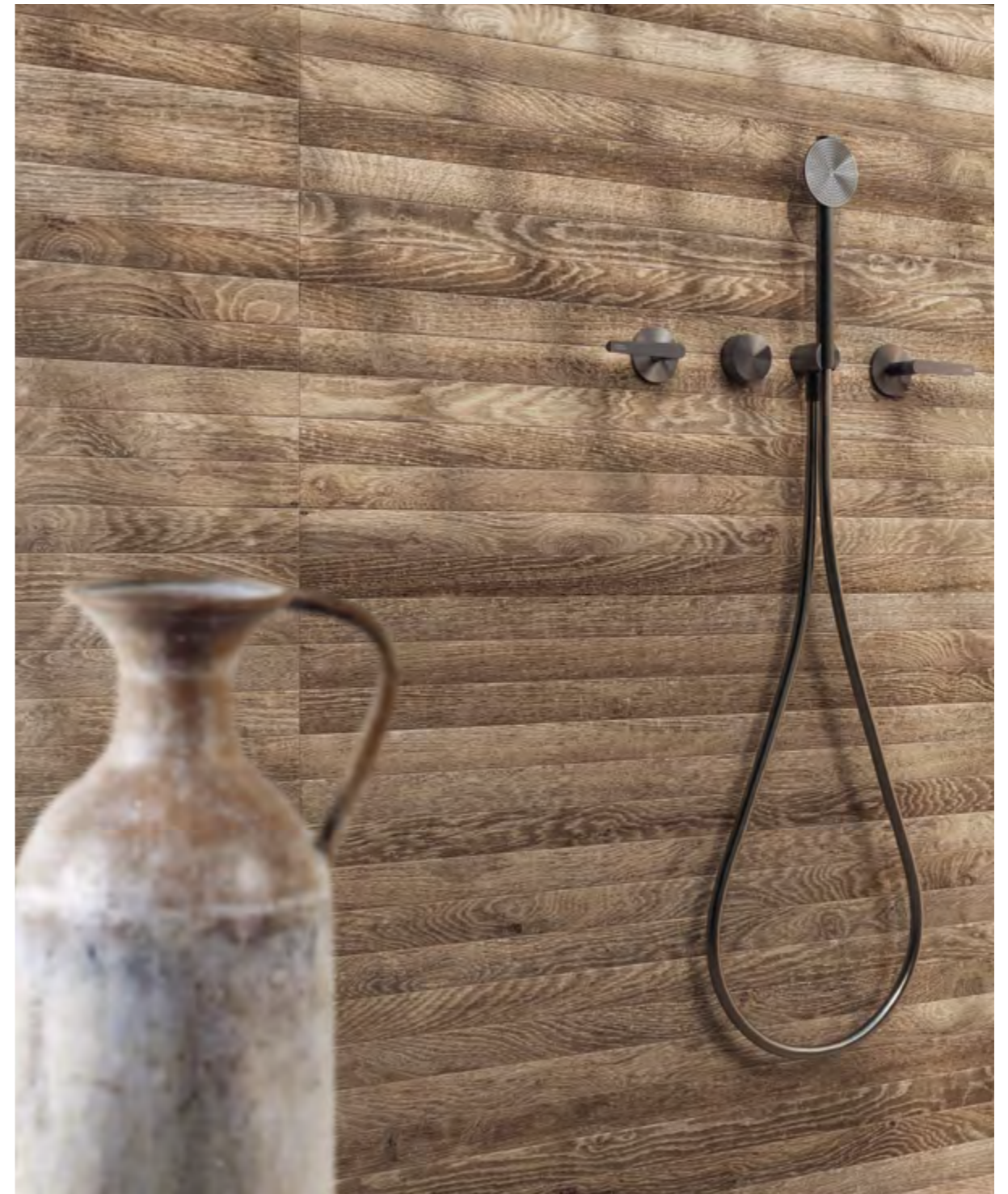
Luni Noce Naturale 20x120 / 7,9"x47,2" - Mosaico Listelli Noce Naturale 20x120 / 7,9"x47,2" - Terrae Gesso Naturale 60x120 / 23,6"x47,2"