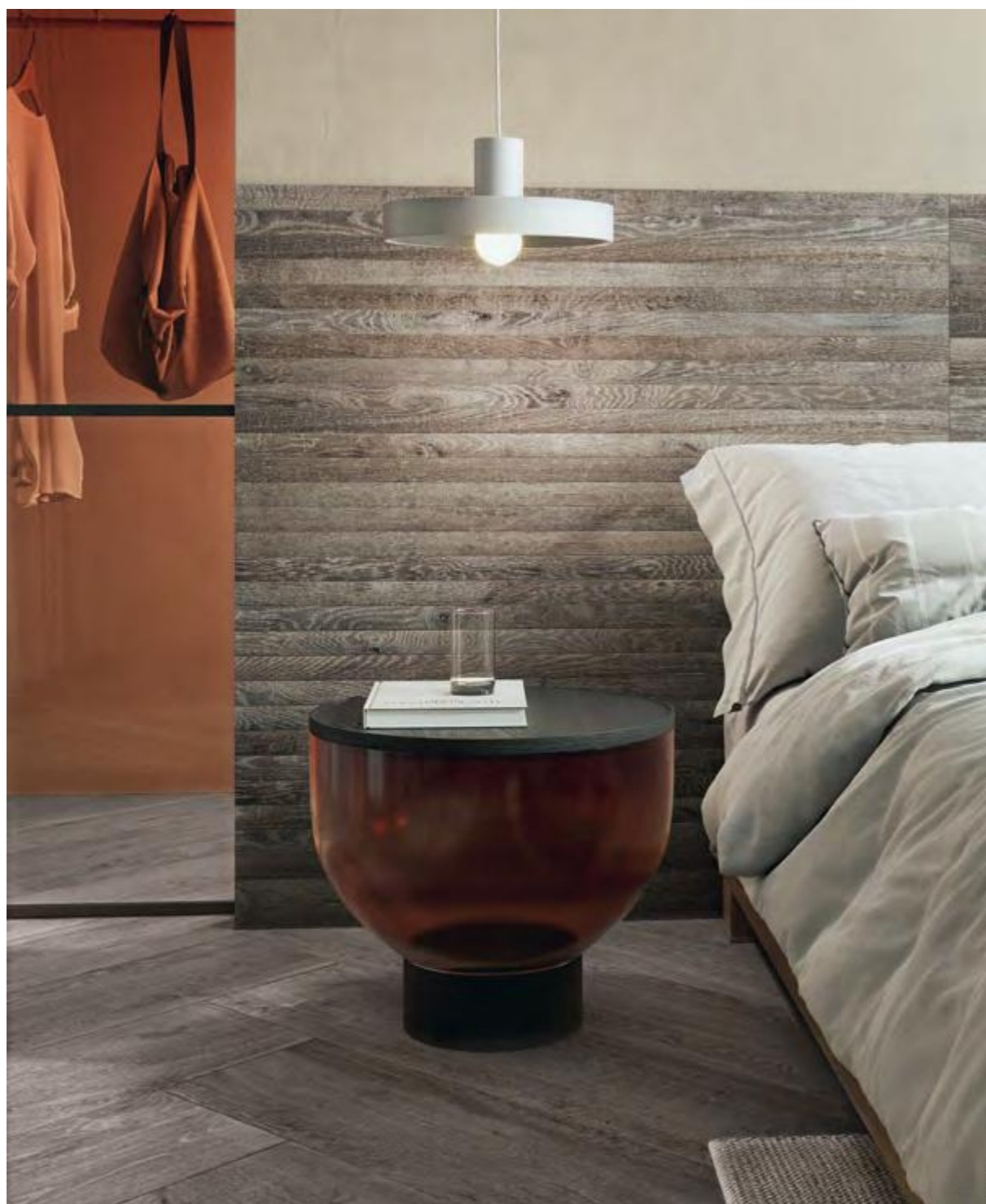
Luni Bruno Naturale 25x150 / 10"x60" - Mosaico Listelli Bruno Naturale 20x120 / 7,9"x47,2"