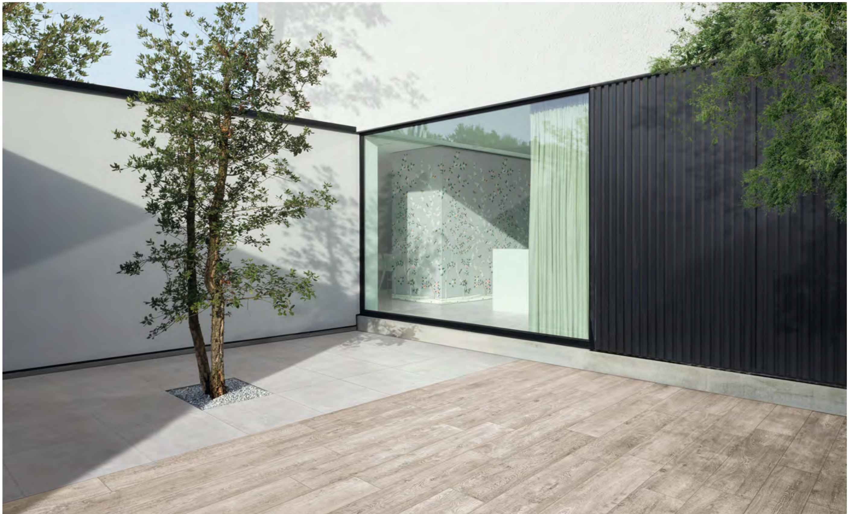
Luni Cenere R11 20x120 / 7,9"x47,2" - Terrae Gesso Naturale R11 60x60 / 23,6"x23,6" - Grandiosa Decoro Nix 120x280 - 47,2"x110,2"